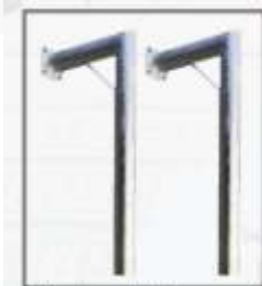
Kit de fijación estructura fija

Jet Port tiene varios bolsillos en ambos lados para unir los Jet Port entre sí con el juego de acopladores o el uso de anclaje de peso muerto. Estos bolsillos se pueden usar para unir Jet Port a las secciones de Rotodock Dock con Coupler Set para construir un sistema de muelle completo.