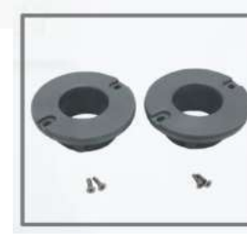
Mangas para tubo 3"