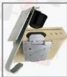
Kit de fijación estructura flotante