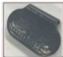
Relleno de bolsillo