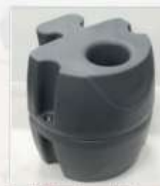
Accesorio de extensión para tubería de 3"