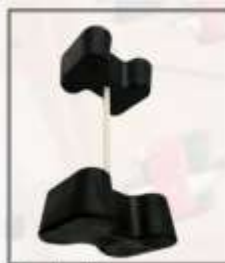
Conjunto de acoplador "hueso de perro"